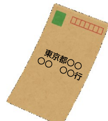
返信用の封筒 (切手付)