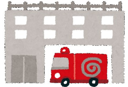
届出対象の建物を 管轄する消防署 (分署や出張所の場合もあります)