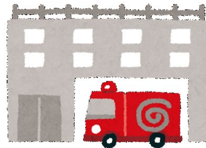
事業所の所在地を 管轄する消防署