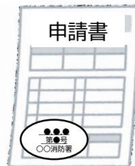
申請書の副本 (消防署の登録印 付き)