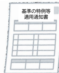
基準の特例等 適用通知書