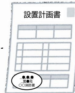
設置計画書の副本 (消防署の登録印付き)