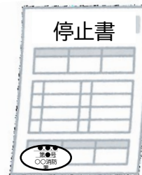
停止報告書一式 消防署の登録印付き