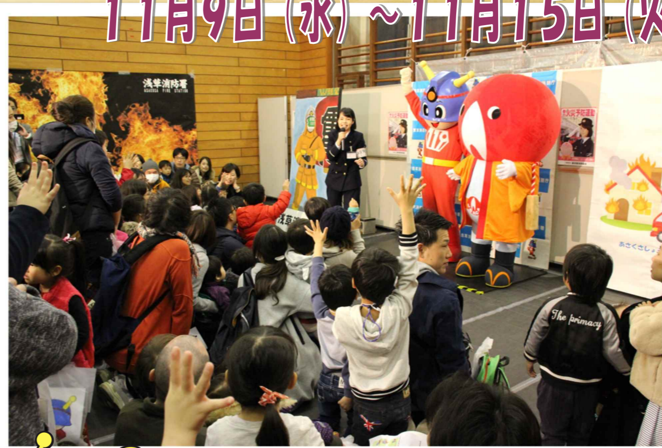
(平成30年 浅草消防署一日公開)