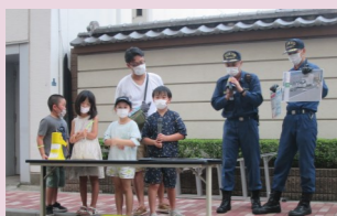
イラストパネルを用いた通報訓練

このコーナーでは、各町会・自治会の防火防災の取り組みをご紹介します。 今回は、 鳥越二丁目町会 です。