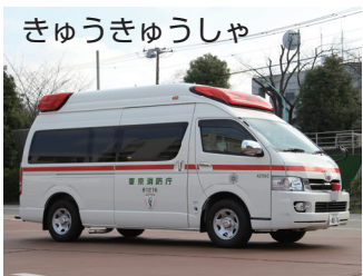
きゅうきゅうしゃ