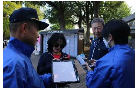
多目的タブレット端末翻訳アプリの活用