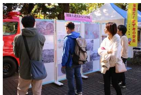
関東大震災から100年パネル展示