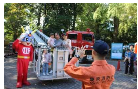
キュータと一緒に