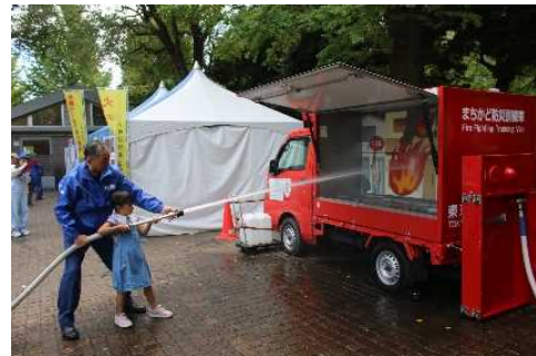
まちかど防災訓練車