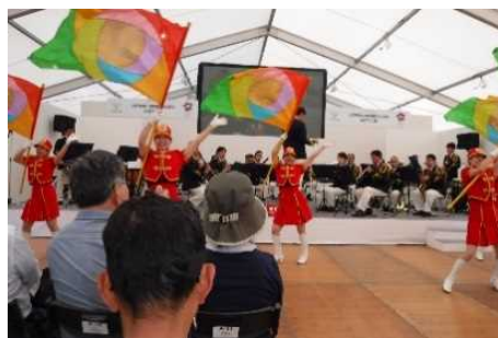
東京消防庁音楽隊・カラーガーズ