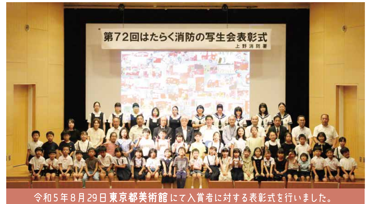
令和5年8月29日東京都美術館にて入賞者に対する表彰式を行いました。