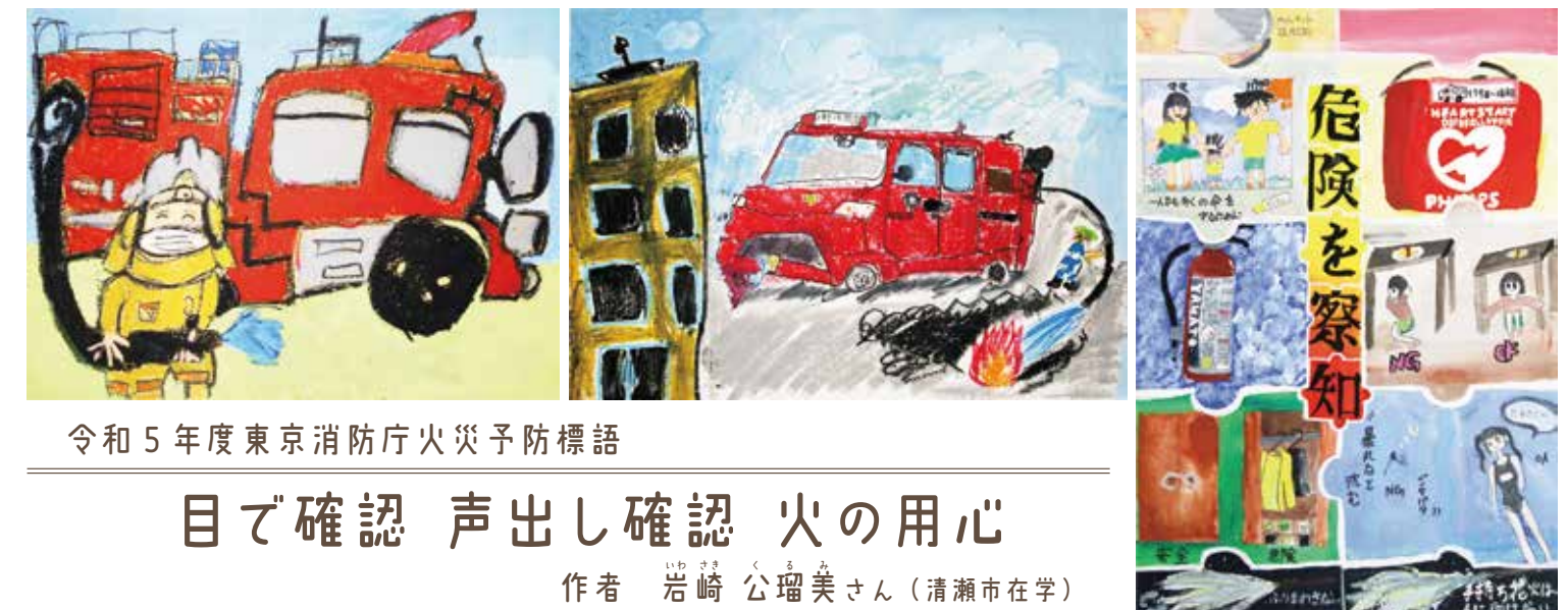
令和5年度東京消防庁火災予防標語