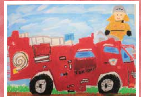
はたらく消防の写生会の様子と優秀作品