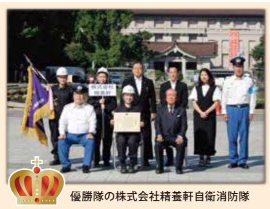
優勝隊の株式会社精養軒自衛消防隊

9月14日(水)感染症防止対策を万全に整え、上野恩賜公園竹の台広場で12事業所12隊が火災における一連の動作の安全・迅速・確実性を競いました。